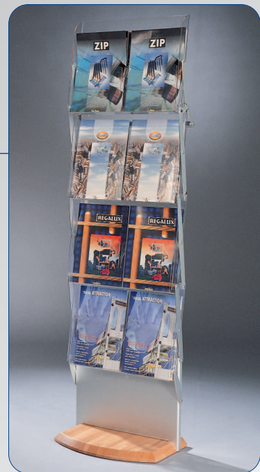
Big Zip mit Fuß aus Massivholz