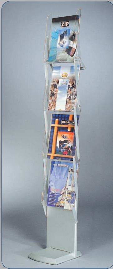
Zip Up mit Fuß in Metalloptik

Für den unkomplizierten Transport erhalten Sie die sehr praktische Nylontasche. Prospekte können während des Transportes im Zip Up verbleiben.