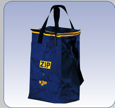
Einfacher Transport mit der Zip Tasche